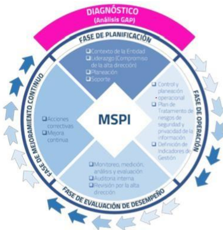
Ilustración 1 Ciclo del Modelo de Seguridad y Privacidad de la Información

Cada una de las fases se dará por completada, cuando se cumplan todos los requisitos definidos en cada una de ellas; La entidad en el momento se encuentra en la fase de Evaluación de desempeño.